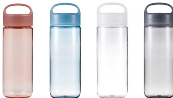
コーラルレッド、スプリングブルー、カームホワイト、スレートブラック