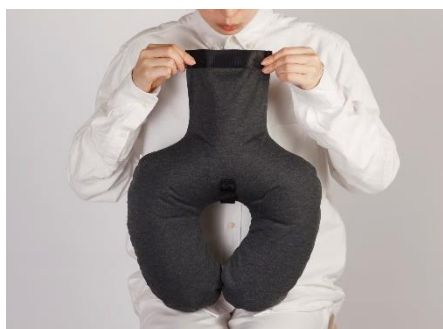
口をつけずに膨らませられる

『fuu ネックピロー』は「エアータ입」でありながら簡単にセットできるため、旅行はもちろん自宅やアウトドアのリラックスタイムなど、様々なシーンでお使いいただけます。