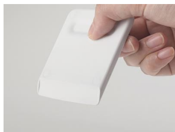
カッターの先端はアーチ状

カッターはフタ裏に収納できるので、バターに触れません。 フタにはパッキンが付いており、乾燥・におい移りにくく、 バターをおいしく保存できます。また、全てのパーツが分解して洗えて、食洗機に対応しています。