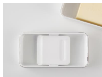
カッターはフタ裏に収納