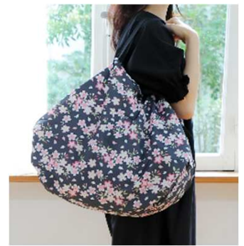
洋装にも合うモダンなデザイン