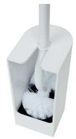
ケースの底にブラシがつかない

※好評発売中の「SLIMトイレブラシ」は1,219円。 「SLIMトイレポット」は933円。