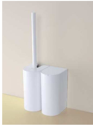
組み合わせて置いても場所を取らない