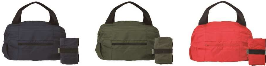
(好評発売中のカラー)ネイビー、カーキ、レッド