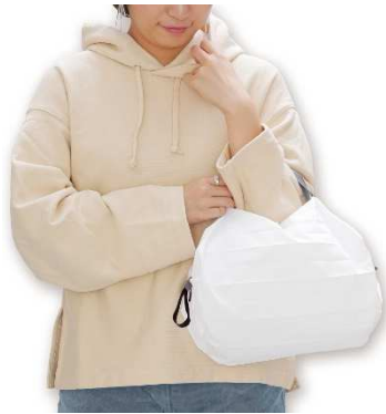
「Shupatto ポケッタブルバッグ」 希望小売価格：980円＋税 容量：7.5L

この度、「Shupatto」シリーズから「Shupatto ポケッタブルバッグ」、「Shupatto コンパクトバッグ M」、「Shupatto コンパクトバッグ L」の3型に、 新色のホワイトを追加すること にいたしました。簡単にコンパクトにたためるほか、袋口が大きく開き荷物が入れやすい点や洗濯機で洗える点など、使いやすい特長で人気の型です。 持ち手がグレーでシンプルなデザインのため 、女性、男性、年代を問わず幅広い層のお客様にお使いいただきたいと考えております。