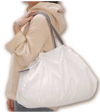
「Shupatto コンパクトバッグ L」 希望小売価格：2,480円＋税 容量：31.4L