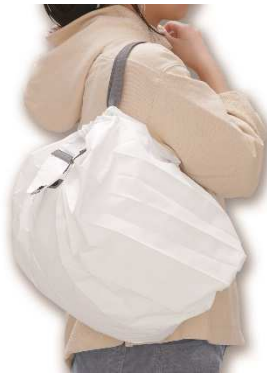
「Shupatto コンパクトバッグ M」 希望小売価格：1,980円＋税 容量：14.5L