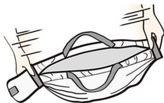
折りたたみイメージ