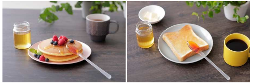
ホットケーキやトーストに塗る