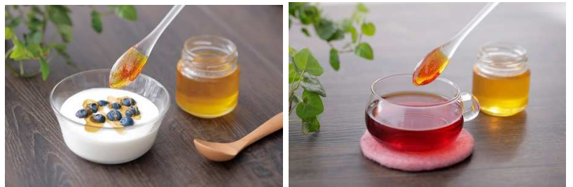
ヨーグルトや飲み物に入れる