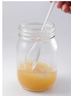
結晶化したはちみつを砕く

パッケージ裏面には、山田養蜂場おすすめの「はちみつ活用術」をそれぞれ紹介しています。 はちみつディッパー 大→肉・魚料理に はちみつディッパー 小→炊飯に